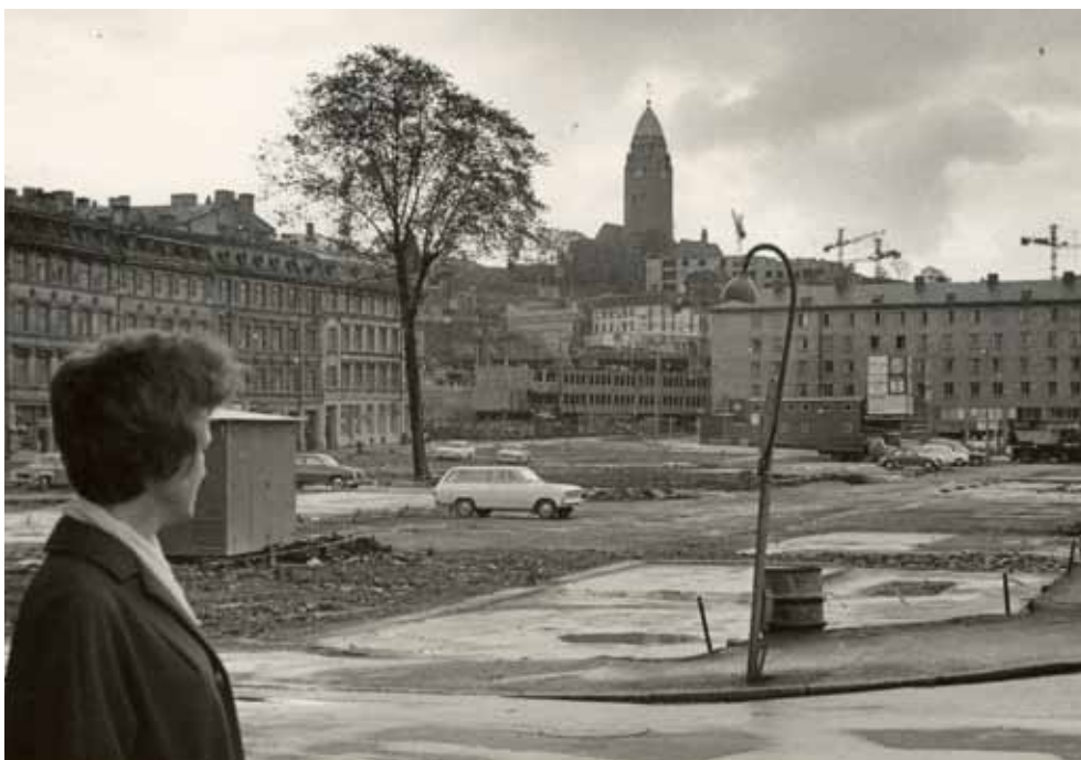
En kvinna beskådar en stad i förändring. Första Långgatan, sent 1960-tal.

och de sista resterna av trävaruindustrin ersattes successivt med kontorsbyggnader och framför allt - parkeringsplatser. w