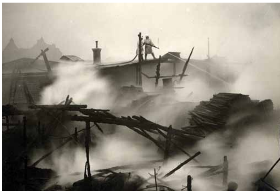
Den stora branden 1915.

Norra Masthuggen var redan på 1800-talet ett viktigt område för stadens trävaruindustri. Ett av de större företagen var Strömman & Larsson som hade verksamheter både i Norra Masthuggen och i Lundbyvassen på andra sidan älven. På Första Långgatan 27 vid Masthuggstorget låg ett av deras kontor – det Strömmanska huset – en tegelbyggnad från andra hälften av 1800-talet. Det är bakom denna byggnad som nuvarande Kommersen börjar byggas, oklart exakt när men troligen runt sekelskiftet 1900. Mellan Första Långgatan och älven fanns vid den här tiden ett och annat tegelhus men majoriteten av byggnaderna var skjul för trävaruindustrin av samma typ som Kommersen. Till följd av många och förödande bränder fick man bara bygga trähus med två våningar. De flesta av husen som trängdes vid Norra Masthuggstorget i början av 1900-talet var trähus om en och två våningsplan. 1915 var en ny brand ett faktum. Branden hade börjat vid Järntorget men tack vare brandmännens insatser förhindrades att elden spred sig och trävaruskjulet klarade sig undan.