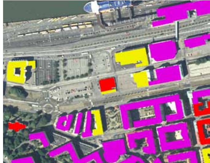
FRÅN VÄNSTER: Norra Masthugget 1942.