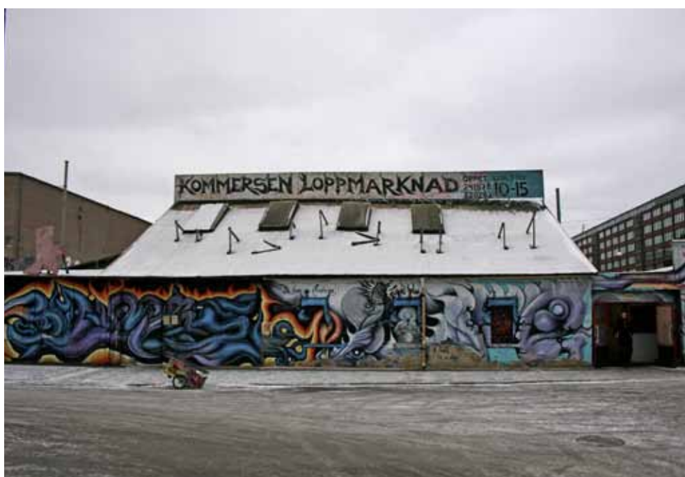
Kommersen januari 2013.