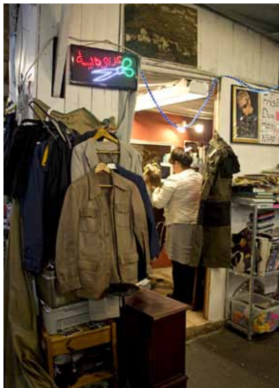
Ingen loppis utan en egen frisör.

Andra framhåller ekonomi och funktion; alla billiga och praktiska prylar man kan införskaffa, som kvinnan som berättar att maken letar verktyg medan hon själv letar efter prylar till barnen som flyttat hemifrån och behöver saker till sina lägenheter. Hållbarhetstemat framhålls av många: ”Återbruk är bra”, ”Detta är bra konsumtionstänk”. ”Halva mitt liv och hela min garderob är från Kommersen”, berättar en 25-årig kvinna från Majorna som besöker Kommersen varje helg. Att loppis och vintage dessutom är inne framhölls av en del besökare, som kvinnan som menade att hon hade ”näsa för vintage” och fyndade ”fräcka grejer” till sig själv och sina barn.