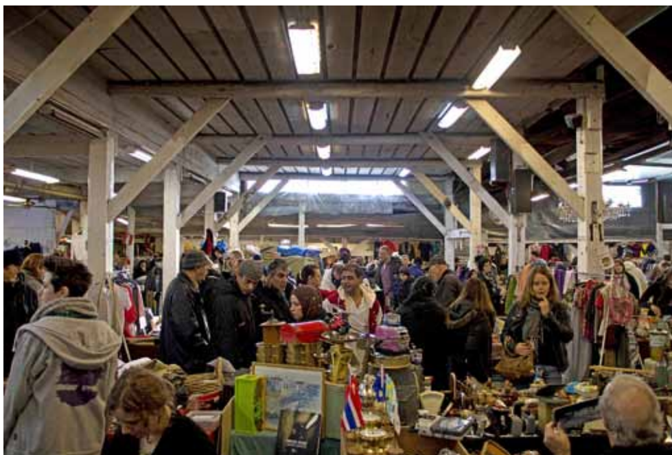
En dag på Kommersen.